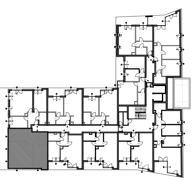
PLAN KONDYGNACJI, SKALA 1:500