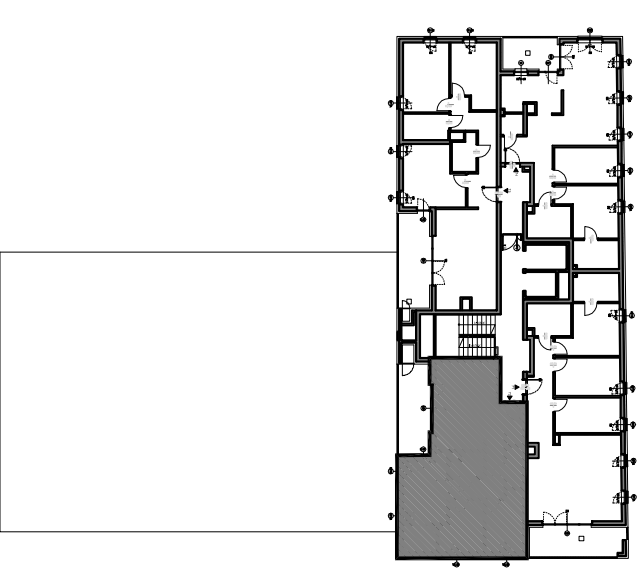
PLAN KONDYGNACJI, SKALA 1:500