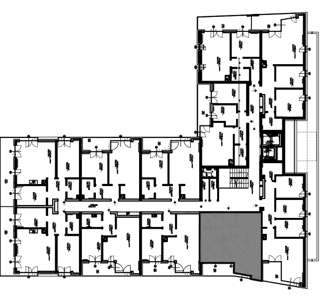
PLAN KONDYGNACJI, SKALA 1:500