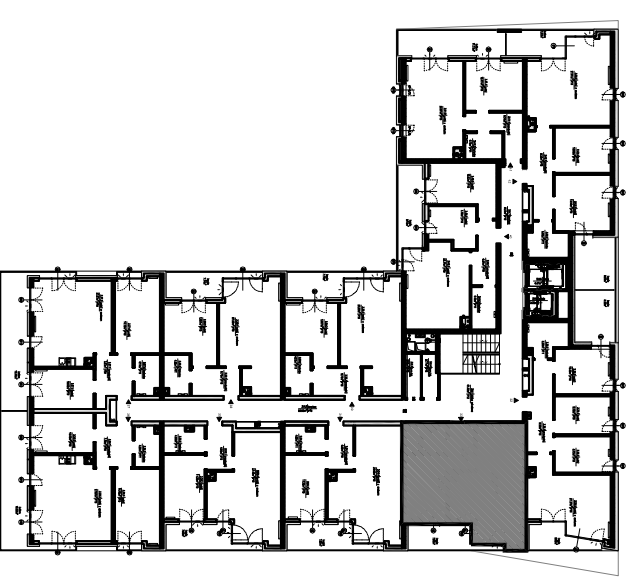
PLAN KONDYGNACJI, SKALA 1:500