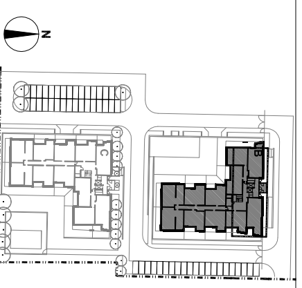
PLAN SYTUACYJNY, SKALA 1:1000