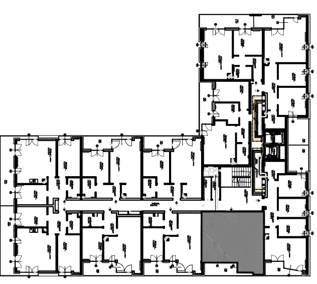
PLAN KONDYGNACJI, SKALA 1:500