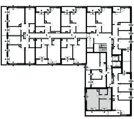
PLAN KONDYGNACJI, SKALA 1:500