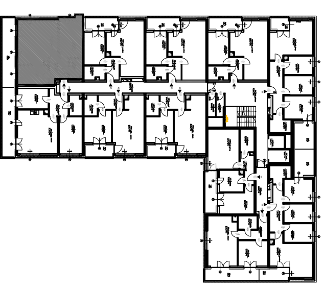
PLAN KONDYGNACJI, SKALA 1:500