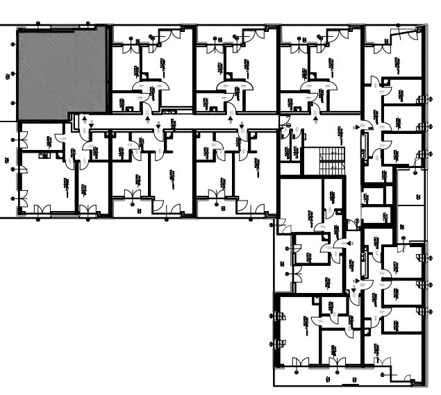
PLAN KONDYGNACJI, SKALA 1:500