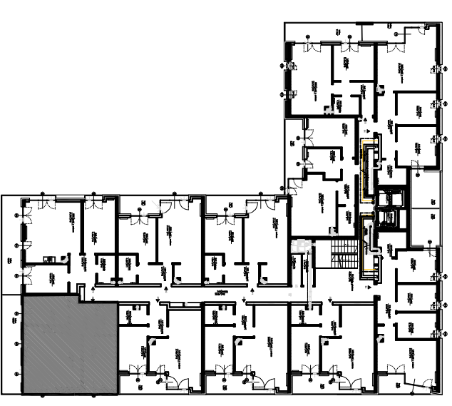
PLAN KONDYGNACJI, SKALA 1:500