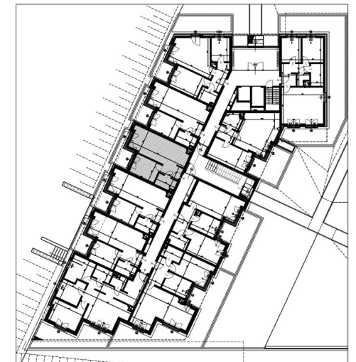
PLAN KONDYGNACJI, SKALA 1:500