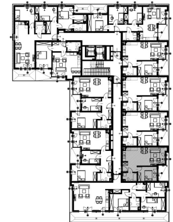
PLAN KONDYGNACJI, SKALA 1:500